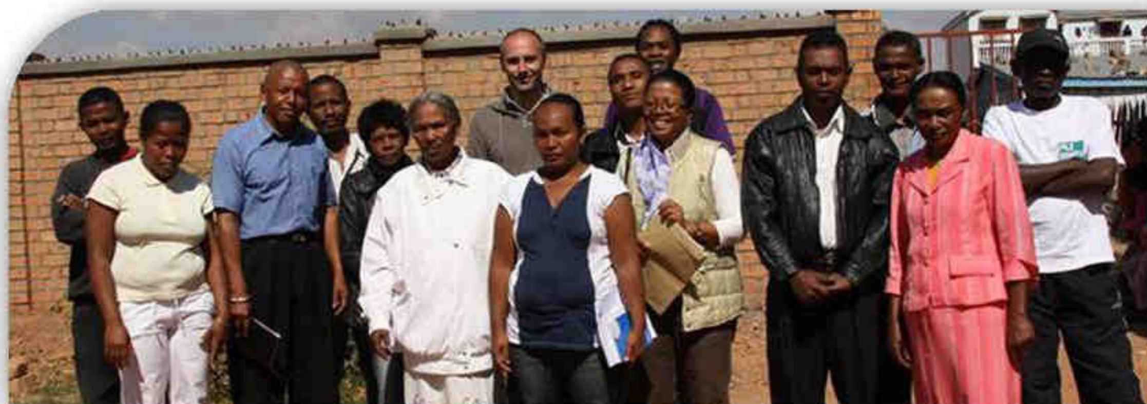
chef fokontany, chefs secteurs, membres du bureau de la localité, le président de l'île aux enfants et la directrice de l'école

Afin de créer les conditions d'un vrai développement, il est indispensable d'avoir la participation active des responsables du quartier (chef fokontany, chefs secteurs, membres du bureau de la localité). Une réunion a été organisée afin de préparer le programme de scolarisation. Notre volonté est que les autorités locales organisent la sélection des enfants comme pour l'école publique. Toutefois, la directrice et l'éducatrice de notre école veilleront à faire une visite dans les ménages pour valider l'inscription. Rendez vous pris le 15 août 2012 pour une deuxième réunion.